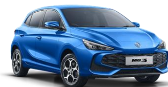
Como MODRA (kovinska) 500,00€