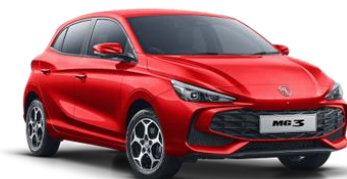
Diamond RDEČA (kovinska) 500,00€