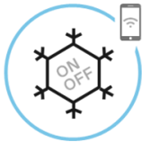
Aplikacija za daljinsko upravljanje