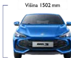
Širina med kolesi spredaj 1558 mm Širina 1797 mm