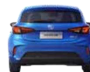
Širina med kolesi zadaj 1553 mm