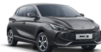
Hampstead SIVA (kovinska) 500,00€