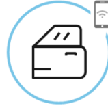
Zaklepanje in odklepanje vozila