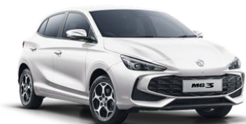
Dover BELA (enoslojna) 0,00€

*Vse prodajne cene (MPC**=maloprodajna priporočena cena) so neobvezujoče priporočene cene in vključujejo 22% DDV in DMV