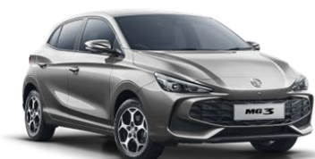
Cosmic SREBRNA (kovinska) 500,00€