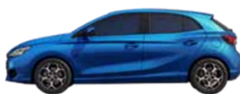
Medosna razdalja 2570mm Dolžina 4113mm