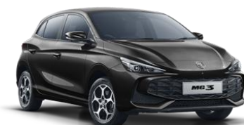
Pebble črna (kovinska) 500,00€