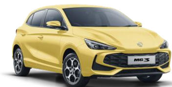
Pastel RUMENA (kovinska) 500,00€